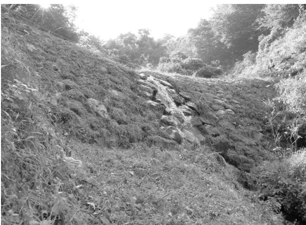
大平ミズヤ上えん堤 堤頂の美しい縄たるみ形状