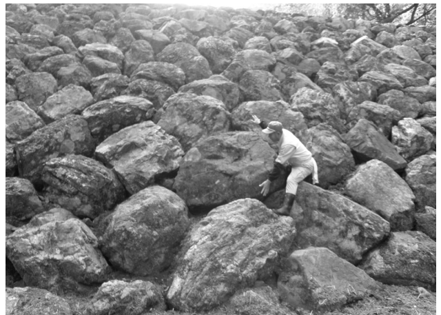
松ヶ端えん堤巨石