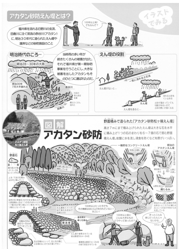
記憶画1 アカタン砂防エコミュージアムマップから転載